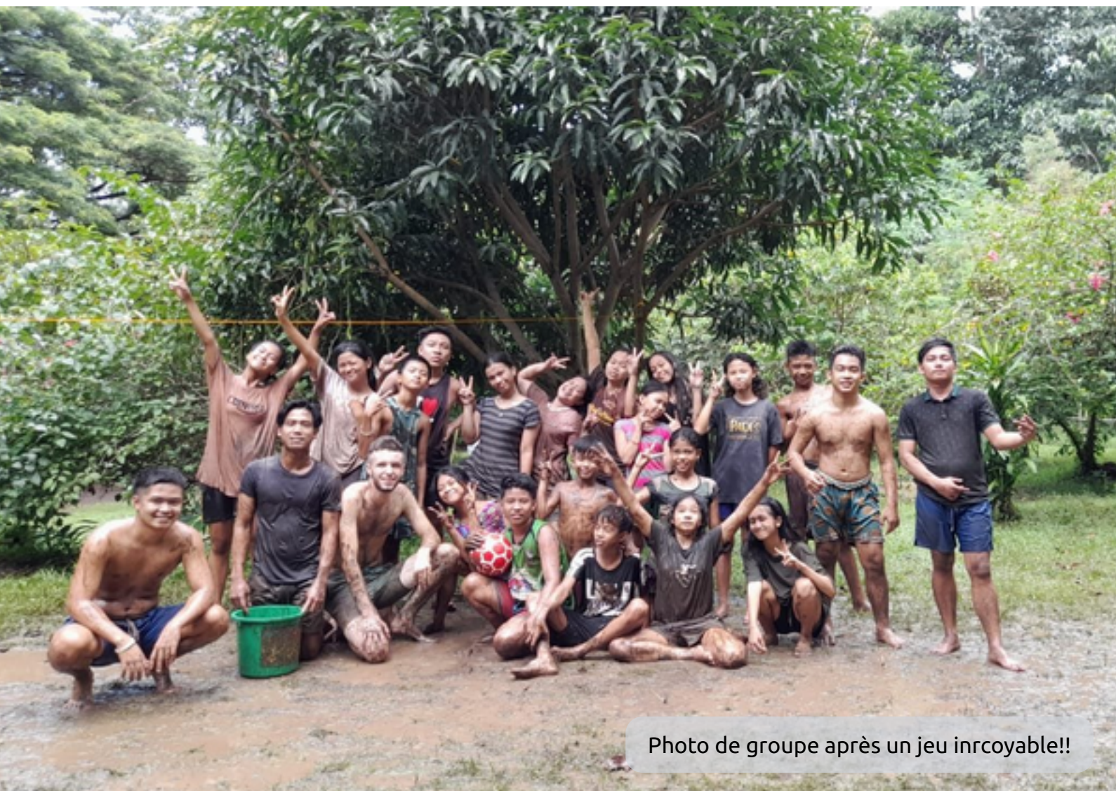
Photo de groupe après un jeu incroyable!!