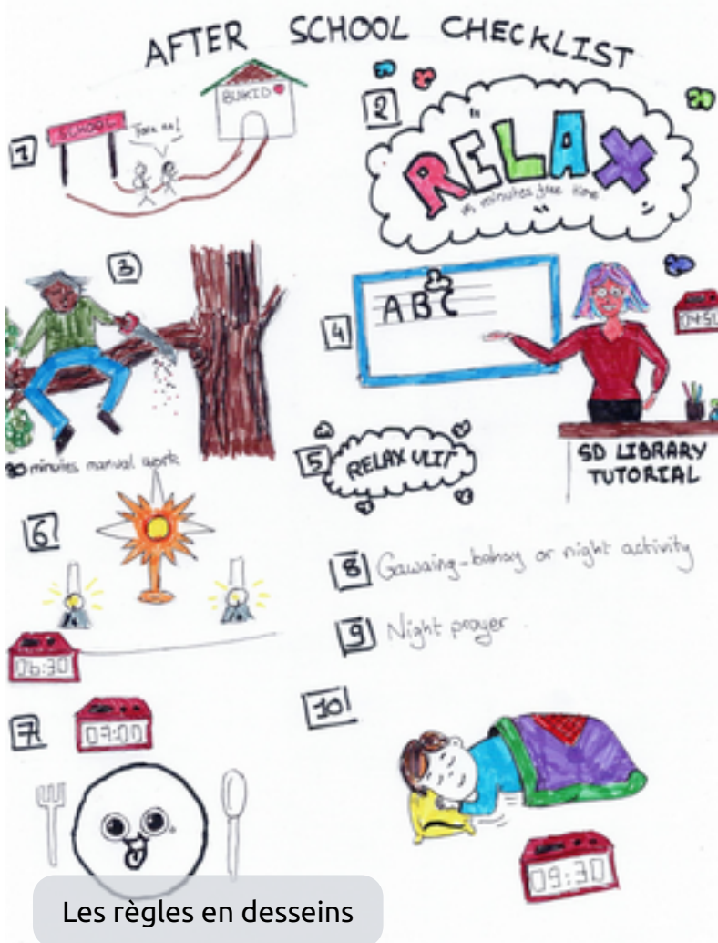
Les règles en dessins