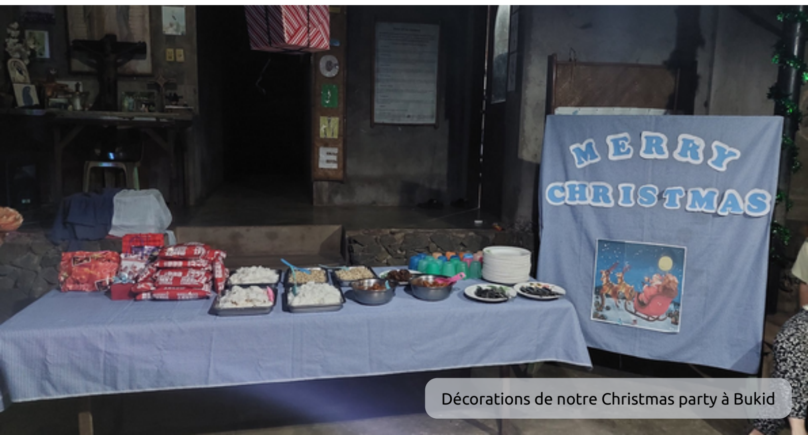
Décorations de notre Christmas party à Bukid

Je vous souhaite une bonne lecture et un joyeux Noël.