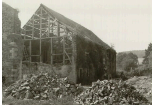
Pondsôme en 1988

Après quelque temps, la famille nous propose d'acheter le reste des bâtiments abandonnés mais encore en bon état. J'y vais de temps à autre faire des séjours avec des jeunes ou des pauvres que nous avons à l'accueil. Nous avons commencé par aménager une petite chapelle « des artisans » et une cui-