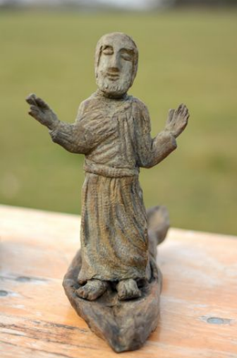
Le Christ Ressuscité (statue faite par frère Marc)

tends la main et mets-la dans mon côté. Et ne pense pas que ta souffrance aveugle soit plus clairvoyante que ma grâce.(...) Mais à présent je suis jeune et ressuscité. Et ta douleur que tu estimes sensée, ta vieille douleur, dans laquelle tu t'enfonces, par laquelle tu crois me prouver ta fidélité, dans laquelle tu penses être avec moi, elle ne vient plus du tout à son heure. Car aujourd'hui je suis jeune et bienheureux. »