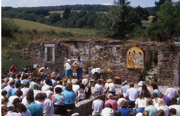
Une célébration avec les jeunes dans les ruines

En 1995, pour le week-end du premier mai, avec 60 jeunes de la jeunesse franciscaine