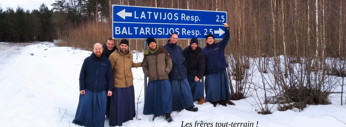
Les frères tout-terrain !