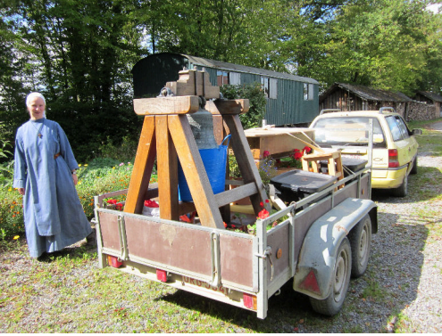
Préparation pour le déménagement