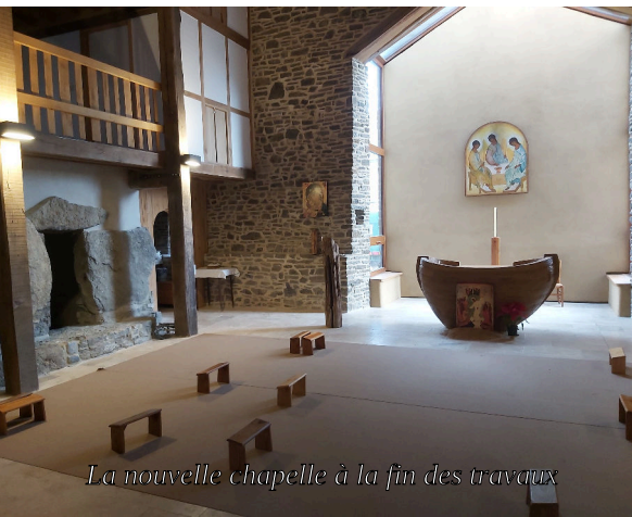
La nouvelle chapelle à la fin des travaux

moments de ce chantier nous reviennent à la mémoire. Tant de choses à réfléchir, choisir, chercher, qu'est-ce qui sera le mieux ? Pour le carrelage, par exemple : nous sommes allées voir jusqu'en Bourgogne, réputée pour ses belles pierres. Comment concilier