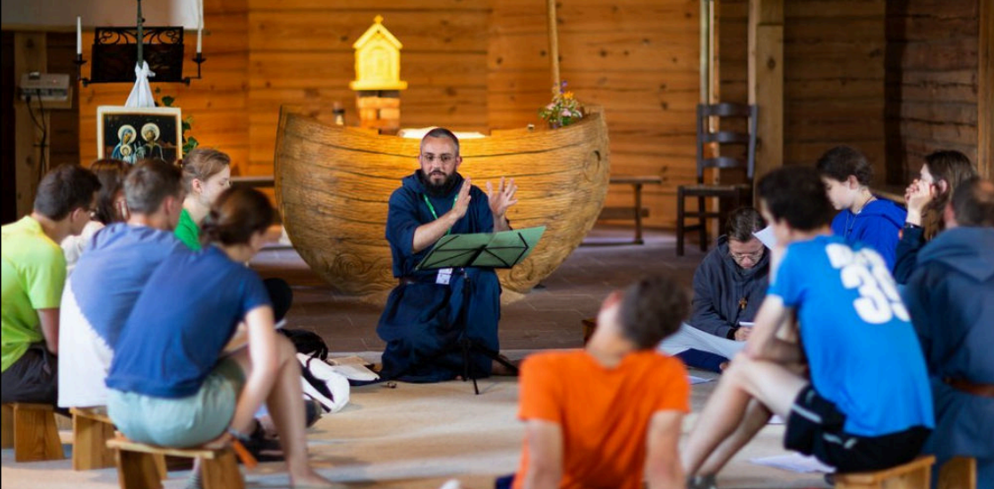
Enseignement pour les jeunes lors du Camp International à Baltriskes

le soir, je me suis joint à quelques frères pour faire un petit tour, au frais, dans Assise. Beau moment fraternel et occasion géniale de parler italien.