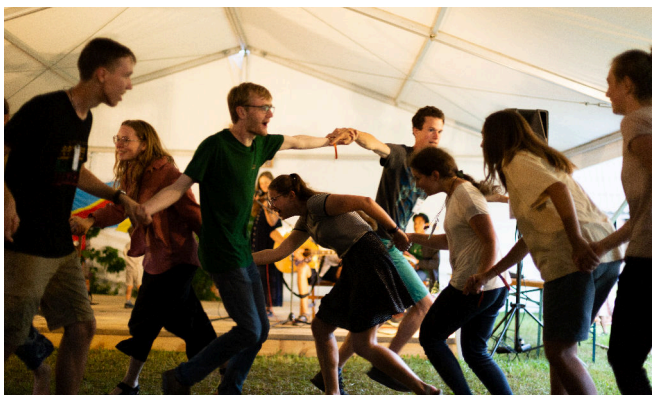
Soirée des danses traditionnelles

Lituanie, Lettonie, Estonie, Belgique, France, Tchéquie, Hongrie... et même du Mexique, Canada et Australie !