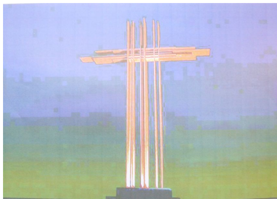
Un projet de la croix

Pour signifier la grandeur et la beauté de la croix d'amour, nous allons élever une grande croix sur une colline proche de Wellin. Cette croix sera vue de l'autoroute, elle sera un moyen d'évangélisation. Cela demande beaucoup de démarches administratives. Nous sommes à une époque où le monde semble avoir la tendance